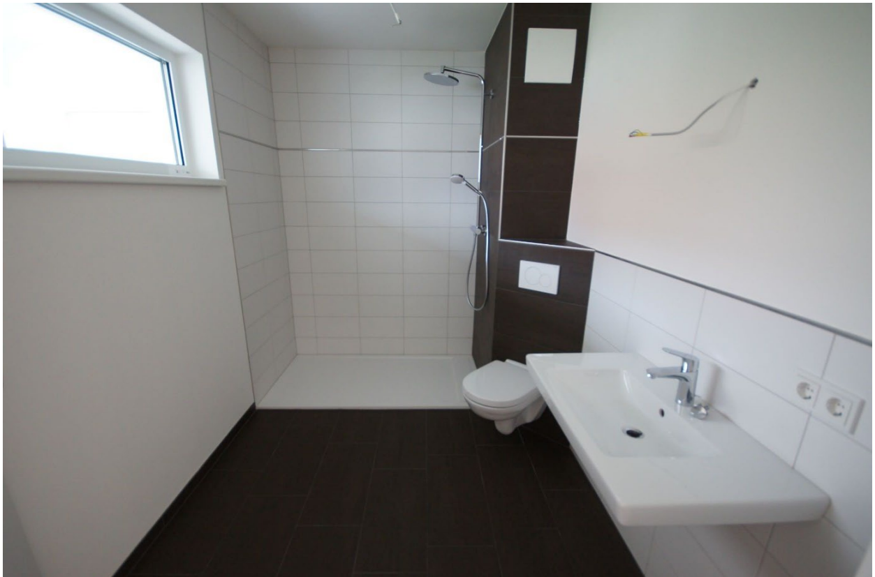
Badezimmer / Wc